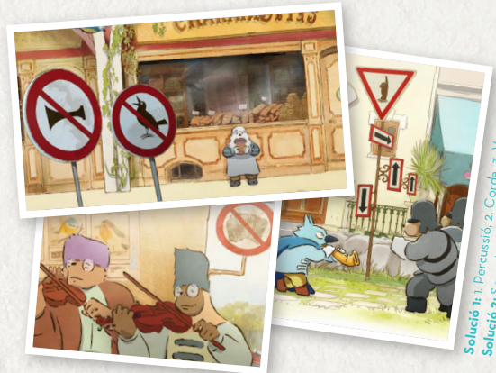
Solució 1: 1. Percussió; 2. Corda; 3. Vent Solució 2: Senyal no 3